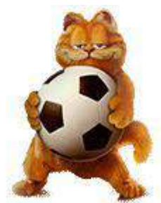
Я и моё здоровье