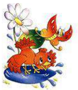
Я и природа

Эти значки используются при оформлении уголков классных и общего уголка.