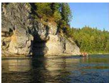
Мой край родной